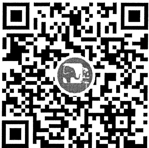
（“河南省教育厅”视频号）

收看方式：扫码关注“河南省教育厅”视频号或“豫教思语”视频号，点击屏幕上“预约”待直播开始即可观看。